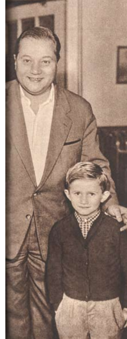
■ Rudolf Hrušínský a syn Jan, 1961