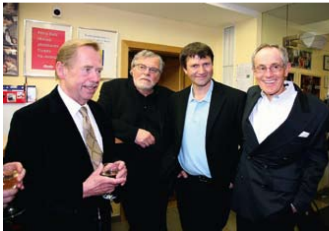
■ Václav Havel a tři Honzové (Kačer, Hrušínský, Tríska) na Jezerce 11. 5. 2007