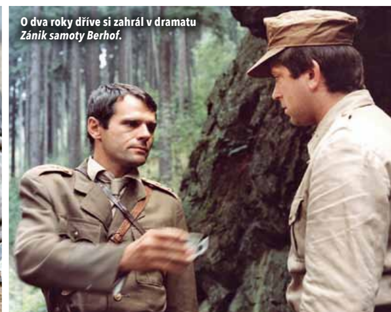
O dva roky dříve si zahrál v dramatu Zánik samoty Berhof.