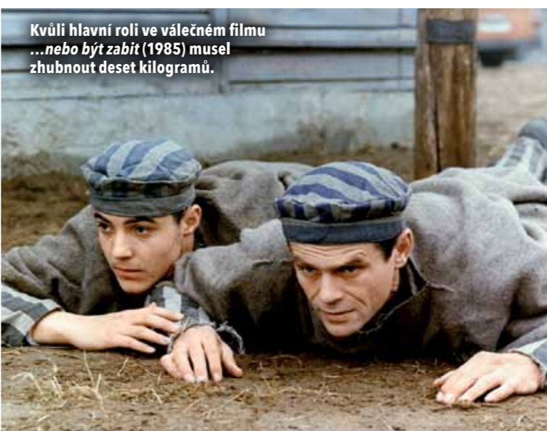
Kvůli hlavní roli ve válečném filmu ...nebo být zabit (1985) musel zhubnout deset kilogramů.